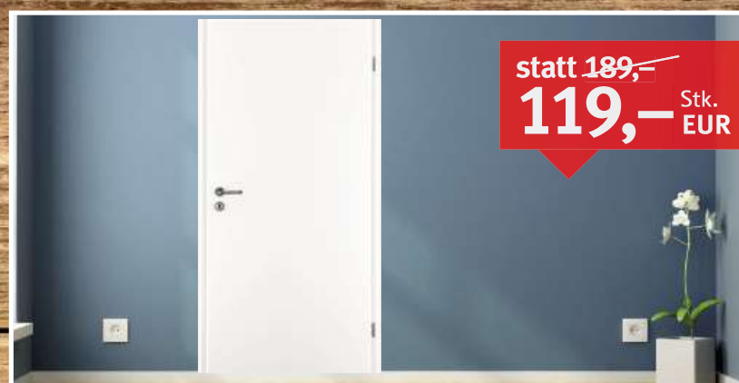
Türblatt PRÜM CPL Touch Whiteline DekorQuer Rundkante, Röhrenspanplatte, 2-tlg. Bänder, BB-Schloss, DIN L/R, Maße: 1.985 x 860/735/610 mm

Röhrenspanplatte statt 149,- 119,- Stk. EUR