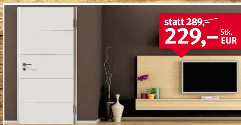
HUGA Türblatt SIGNUM 15 Weisslack Rundkante, Röhrenspanplatte, 2-tlg. Bänder, BB-Schloss, DIN L/R, Maße: 1.985 x 860/735/610 mm