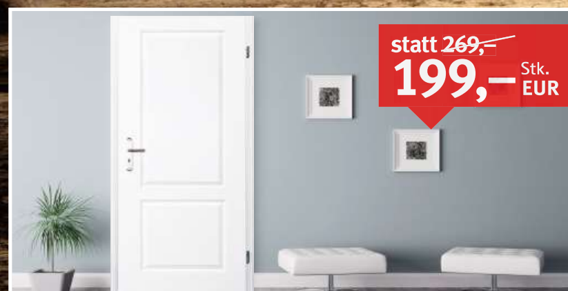
PRÜM Türblatt CLASSIC C2 Weisslack Karnieskante, Röhrenspanplatte, 2-tlg. Bänder, BB-Schloss, DIN L/R, Maße: 1.985 x 860/735/610 mm