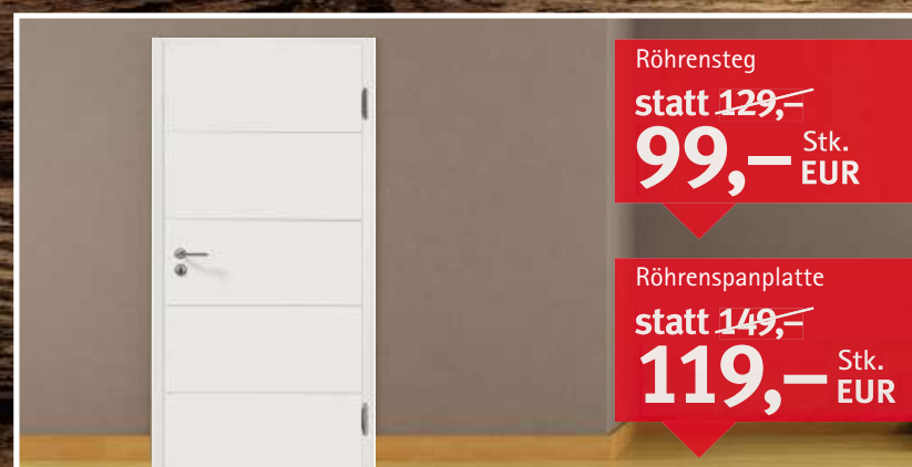
HUGA Türblatt DURAT Weisslack Deko Rundkante, 2-tlg. Bänder, BB-Schloss, DIN L/R, Maße: 1.985 x 860/735/610 mm